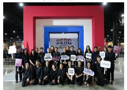
วันต่อต้านคอร์รัปชันสากล