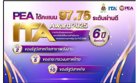
การประเมินคุณธรรมและความโปร่งใสของหน่วยงานภาครัฐ (ITA)