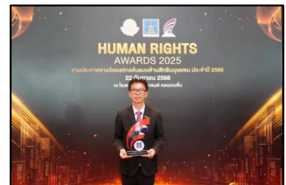
รางวัลองค์กรต้นแบบด้านสิทธิมนุษยชน