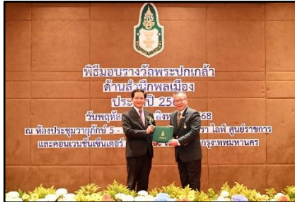
รางวัลพระปกเกล้า ด้านสำนึกพลเมืองระดับดี ประจำปี 2568