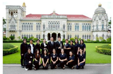
รางวัลศูนย์ข้อมูลข่าวสารของราชการโดดเด่น ประจำปี 2568