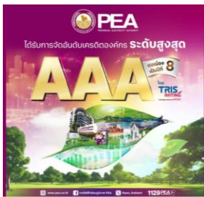
TRIS Rating คงอันดับเครดิต PEA ที่ระดับสูงสุด “AAA”