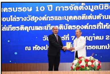
รางวัลหน่วยงานที่ให้การสนับสนุนมูลนิธิต่อต้านการทุจริตอย่างดียิ่ง