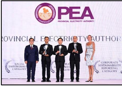
รางวัล Asia Responsible Enterprise Award 2025