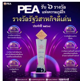
รางวัลรัฐวิสาหกิจดีเด่น ประจำปี 2568