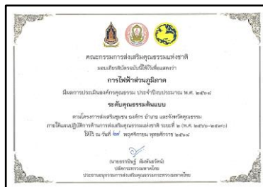
รางวัลองค์กรคุณธรรมระดับคุณธรรมต้นแบบ