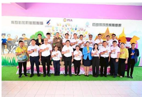
โครงการ PEA หมู่บ้านซื่อสะอาด