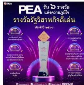
รางวัลรัฐวิสาหกิจดีเด่น ประจำปี 2568