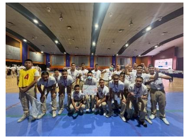
การจัดอบรมหลักสูตรด้านทุจริตศึกษา ให้กับนักเรียนช่าง กฟผ.