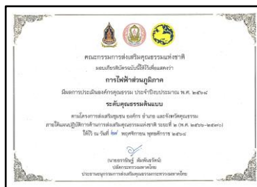
รางวัลองค์กรคุณธรรม ระดับคุณธรรมต้นแบบ