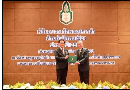
รางวัลพระปกเกล้า ด้านสำนึกพลเมืองระดับดี