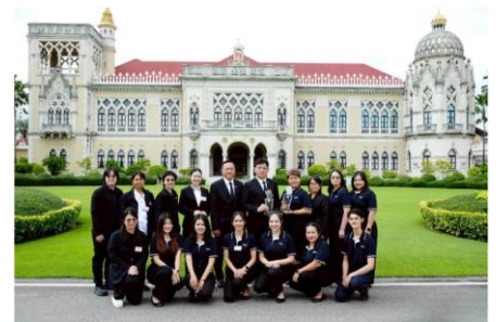
รางวัลศูนย์ข้อมูลข่าวสารของราชการโดดเด่น ประจำปี 2568