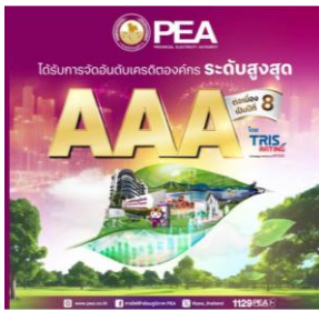
TRIS Rating คงอันดับเครดิต PEA ที่ ระดับสูงสุด “AAA”