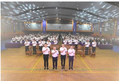
กิจกรรมประกาศเจตจำนงป้องกันและ ปราบปรามการทุจริตคอร์รัปชัน