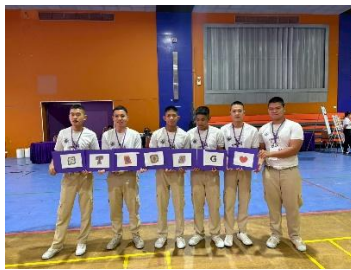
การจัดอบรมหลักสูตรด้านทุจริตศึกษา ให้กับนักเรียนช่าง กฟผ.