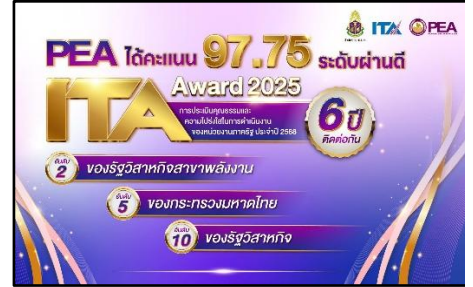
การประเมินคุณธรรมและความโปร่งใส ของหน่วยงานภาครัฐ (ITA)