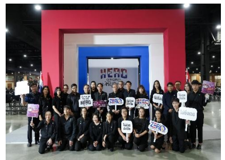
วันต่อต้านคอร์รัปชันสากล