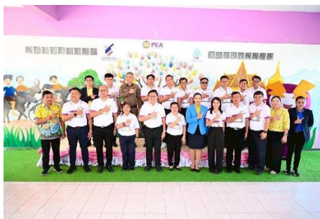
โครงการ PEA หมู่บ้านซ่อสะอาด